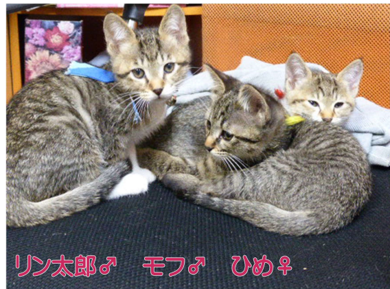
リン太郎♂ モフ♂ ひめ♀