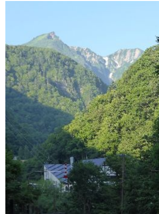
黒岳とロープウェイ乗場