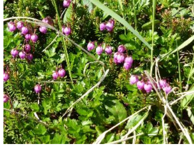
エゾノツガザクラ