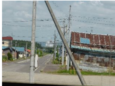
幸せの黄色いハンカチの舞台にでも なりそうな風景