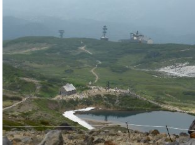
縦走のゴール、旭岳のロープウェイ乗場