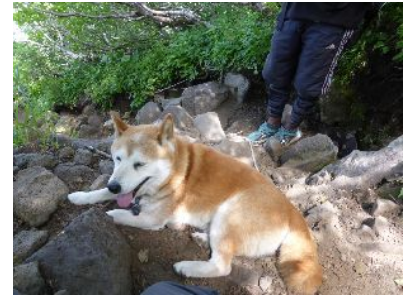
下りで合った高齢のシバクン。 この後、飼い主と下山した模様