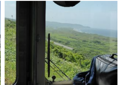
稚内は日本海に向かう坂の街。 半年前に訪れたチリのPunta ArenasやUshuaiaを思い出す。