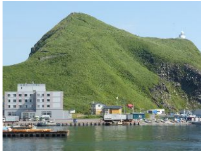
宿泊した利尻マリンホテル。 ペシ岬と鷺泊灯台