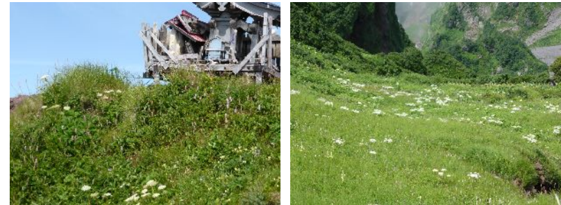
エゾノハクサンイチゲ、オオカサモチ、エゾノヤマゼンゴ