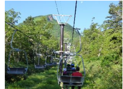
ロープウェイを降りて、リフトで上へ