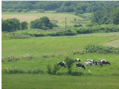
サロベツ原野を走る