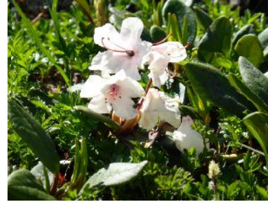
キバナシャクナゲ