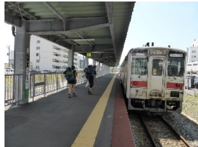
稚内は、宗谷本線の始発駅 海外からの観光客が多い。