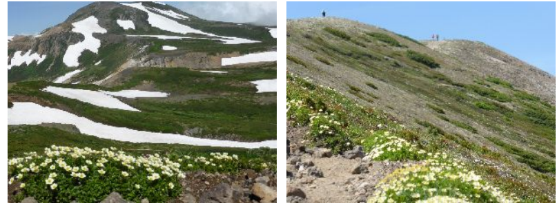
凌雲岳を望む大雪の御鉢平