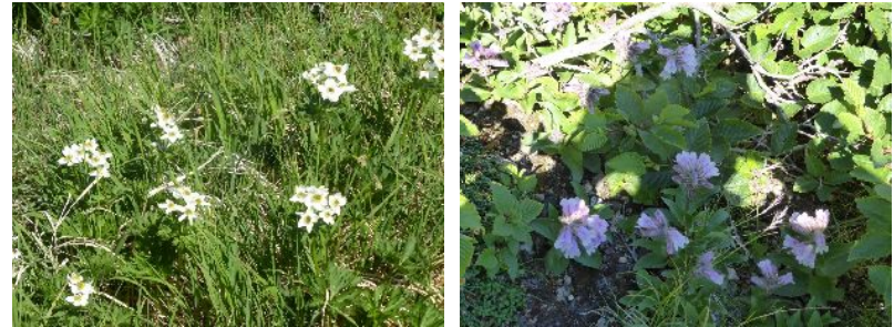
エゾノハクサンイチゲ