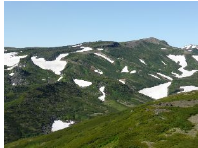
今から迎える北海岳への稜線